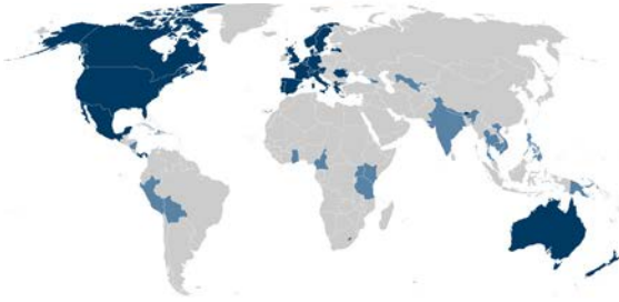
Introducción de la vacuna del VPH. Situación en el 2010