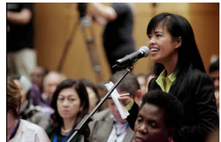
Participantes de diferentes países se involucraron, en junio de 2013, en el Foro Mundial sobre la Prevención del Cáncer Cervical, copatrocinado por la CCA.

En el 2012, la GAVI Alliance empezó a solicitar aplicaciones para que se subsidiara la vacuna del VPH. Desde entonces, GAVI se ha comprometido a vacunar a 30 millones de niñas, para el año 2020. Hoy, muchos de los países más pobres del mundo han comenzado con programas pilotos o nacionales para la vacuna de VPH.